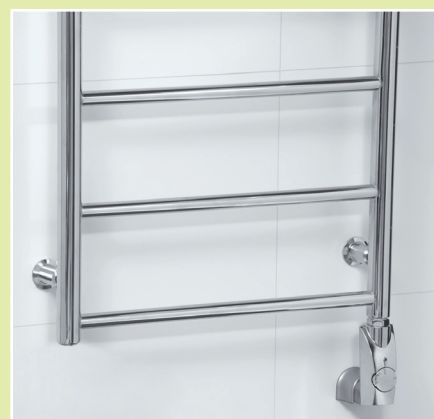
Handdukstork NÄÄS i krom (NKC0860). Fabriksfylld med vätska och monterad med elpatron heter den NKE0860. 6

Monterad med en elpatron kan handdukstorken användas oavhängigt av centralvärmesystemet. Elpatronen har dold elanslutning (gäller ej Ekenäs). Radiatorn är vätskefylld från fabrik, har strömbrytare och steglös termostat som reglerar vätskans temperatur (gäller ej Ekenäs, Almenäs och Hästevik). Elpatronerna finns i vitt, krom, borstat och i antracit i effekterna 150-300-600 W beroende på modell och storlek. (Se prislistan).