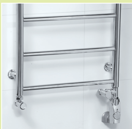
Handdukstork NÄÄS i krom (NKC0860) + T-rör (TC1) + ventilset vinkel (VK7) + kromad elpatron 150W (PK1). 5

Den elegantaste lösningen vid vägganslutning. När det inte är eldningssäsong används elanslutningen. OBS! c/c-måttet för vägganslutning är inte detsamma som vid anslutning till centralvärme, se sidan 112. Denna kombination är inte möjlig på Ekenäs och R--1505.