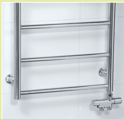
Handdukstork NÄÄS i krom (NKC0860) + kromad NH-ventil (NK1). 1

NORDHEMS handdukstorkar kan anslutas till husets centrala värmesystem med en designad NH-ventil. Förkromade med handratt för manuell steglös värmereglering eller med termostat.